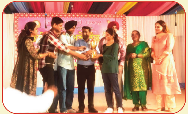
ਪੰਜਾਬੀ ਯੂਨੀਵਰਸਿਟੀ, ਪਟਿਆਲਾ ਦੇ ਖੇਤਰੀ ਯੁਵਕ ਅਤੇ ਲੋਕ ਮੇਲੇ ਦੇ 'ਕੁਇਜ਼' ਮੁਕਾਬਲੇ ਵਿਚ ਦੂਜਾ ਸਥਾਨ ਪ੍ਰਾਪਤ ਕਰਨ ਵਾਲੀ ਟੀਮ ਟਰਾਫੀ ਹਾਸਲ ਕਰਦੀ ਹੋਈ।