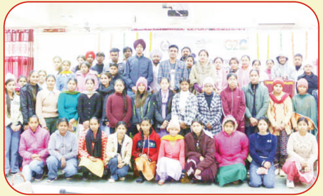
ਕਾਲਜ ਦੀ 'ਇੰਸਟੀਚਿਊਸ਼ਨਲ ਇਨੋਵੇਸ਼ਨ ਕਾਊਂਸਲ' ਵੱਲੋਂ ਕਰਵਾਏ ਗਏ 'ਮੋਟੀਵੇਸ਼ਨਲ ਸੈਸ਼ਨ' ਵੇਲੇ ਮੁੱਖ ਬੁਲਾਰੇ ਨਾਲ ਵਿਦਿਆਰਥੀ ਅਤੇ ਸਟਾਫ਼ ਮੈਂਬਰ।