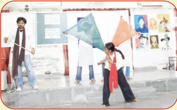
ਸ਼ਹੀਦ-ਏ-ਆਜ਼ਮ ਸ. ਭਗਤ ਸਿੰਘ ਜੀ ਦੇ ਸ਼ਹੀਦੀ ਦਿਹਾੜੇ ਮੌਕੇ ਕਰਵਾਏ ਗਏ ਪ੍ਰੋਗਰਾਮ ਦੌਰਾਨ ਵਿਦਿਆਰਥੀ ਨਾਟ-ਪੇਸ਼ਕਾਰੀ ਦਿੰਦੇ ਹੋਏ।