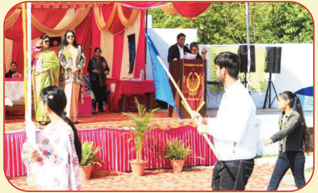
43ਵੀਂ ਸਲਾਨਾ ਐਥਲੈਟਿਕ ਮੀਟ ਦੌਰਾਨ ਮਾਰਚ ਪਾਸਟ ਮੌਕੇ ਸਲਾਮੀ ਦਿੰਦੇ ਮੁੱਖ ਮਹਿਮਾਨ ਅਤੇ ਕਾਲਜ ਪ੍ਰਿੰਸੀਪਲ।