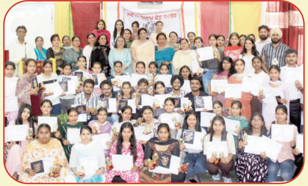
ਕਾਲਜ ਵਿਚ ਕਰਵਾਏ ਗਏ 'ਸਲਾਨਾ ਇਨਾਮ ਵੰਡ ਸਮਾਰੋਹ' ਦੌਰਾਨ ਇਨਾਮ ਹਾਸਲ ਕਰਨ ਵਾਲੇ ਵਿਦਿਆਰਥੀਆਂ ਨਾਲ ਪ੍ਰਿੰਸੀਪਲ ਅਤੇ ਬਾਕੀ ਸਟਾਫ਼ ਮੈਂਬਰ।